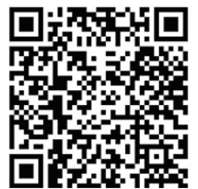
ประกาศกรมศุลกากร ที่ 163/2563